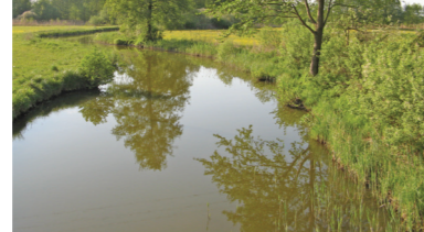
Jezioro Świętym