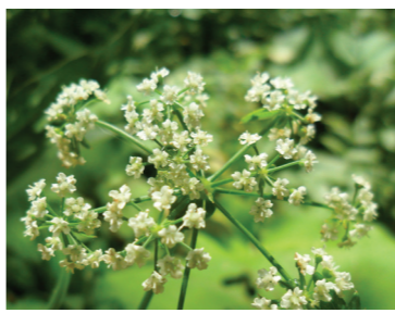
Selerzy błotne

oraz rzadką traszkę grzebieniastą. Spośród płazów bezogonowych spotkać można między innymi ropuchę szarą, żabę jeziorową, kumaka nizinnego oraz wyjątkowo liczną populację rzekotki drzewnej. Najwięcej żab i ropuch pojawia się w północno-wschodniej części parku, nad jeziorami: Wielkim, Małym, Trzebidzkim, Boszkowskim, oraz na brzegach łączących je cieki. Zdecydowanie najliczniejszą, a także najciekawszą grupą zwierząt w parku są ptaki. Regularnie występuje tu ponad 140 legowych gatunków, a w okresie przelotów liczba ta rośnie do niemal 190. Większość z nich związana jest z siedliskami wodno-błotnymi. Płynny obserwator może dostrzec: czaple siwą i białą, bąkę, bączka, dęrkacza, wąsatkę, lelkę, perkozka czy będko. Symbolem parku perkozka dwuczubego. Z ptaków drapieżnych spotykamy między innymi bielikę, kanię rudą i czarną, błotniaka stawowego oraz rybolowa. Amatorów podglądania ptaków z bliska należy odwiedzić w okolicy Jeziora Trzebidzkiego i otaczających je łąk i mokradł, a także nad jeziora: Małkie, Górskie i Ostrońskie. Uzupełnieniem awifauny są liczne dziuplaki zamieszkujące tutejsze kompleksy leśne, w tym znacząca populacja dzięcioła średniego. Spośród ssaaków, poza pospolitymi gatunkami, można spotkać tu chronione: wydrę europejską oraz bobra europejskiego. Największym zagrożeniem dla tego regionu, podobnie jak dla innych terenów pojeziernych, jest nadmierny i niekontrolowany rozwój turystyki. Cechy charakterystyczne takiego terenu stanowiące o jego dużej