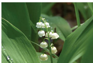
Konwalia majowa