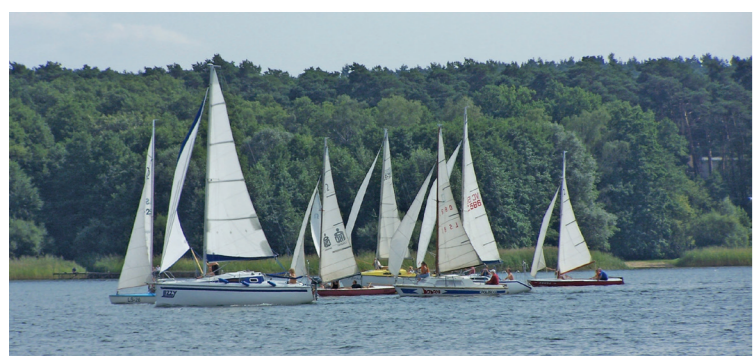
Regaty Jęglarskie na Jeziorze Dominickim

Przemęcki Park Krajobrazowy to wspaniałe miejsce dla turystów zainteresowanych aktywnym spędzaniem czasu. Gęsta sieć dobrze ze sobą połączonych szlaków turystycznych pozwala na bezpieczne przemierzenie parku zarówno pieszo, jak i rowerem, kajakami czy na konskim grzbiecie. Zdecydowanie największy ruch turystyczny przypada na okres letni, koncentruje się nad jeziorami i wokół trzech największych miejscowości wypoczynkowych: Boszkowa Lehńska, Wieleńia Zaobrzańskich oraz Brenna. Parkowe jeziora oferują świetne warunki do uprawiania żeglarsstwa, w tej kwestii zdecydowany prym wiodzie Jezioro Dominickie. Dodatkowo większość zbiorników wodnych jest ze sobą połączona, tworząc niezwykle malowniczy Kajakowy Szlak Konwaliowy, pozwalający przepłynąć niemal wszystkie jeziora parku w ciągu niecałych dwóch dni. Dla turystów stroniących od wody ciekawą ofertą będą wycieczki piesze, rowerowe lub konne. Podczas nich można zapoznać się z ciekawą przyrodą i historią parku i odwiedzić jedną z trzech zachwycających panoram wiew widokowych (w Dominicach, Olejnicy lub Siekowie) aby podziwiać park z nieco innej perspektywy.