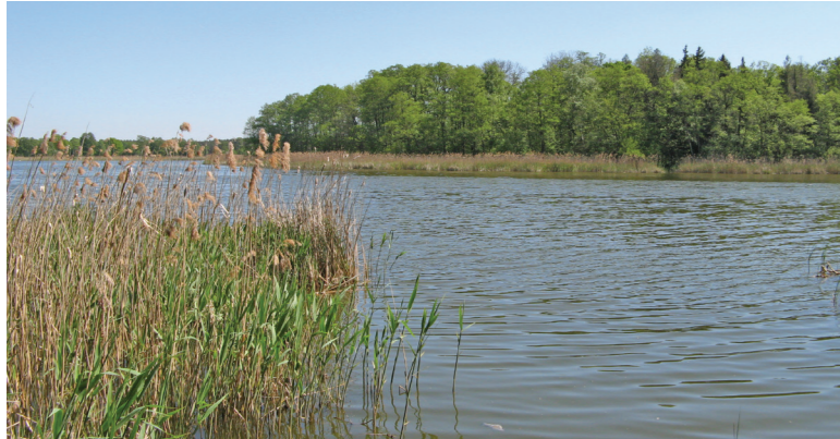
Widok na Wyspę Konwaliową na Jeziorze Radomierskim