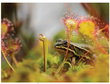
Zabja jeziorowa