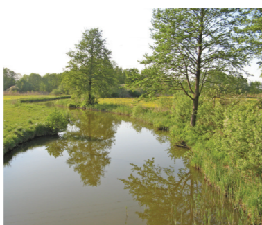
Konwaliowy Szlak Kajakowy