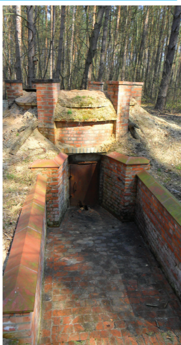
Rezerwa w leśnictwie Krzyżowiec